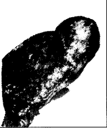
左側：長期間喫煙者の肺