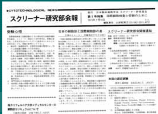
サイトスクリーナー研究部会報 第1号 創刊