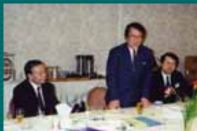
スタッフルームにて