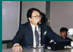
杉下先生を囲んで