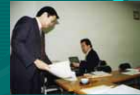
上段:スタッフルームにて