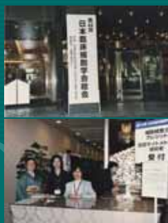
上段 会場入り口 下段 会場受付