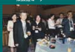
懇親会(右下写真:プロのジャグリング)