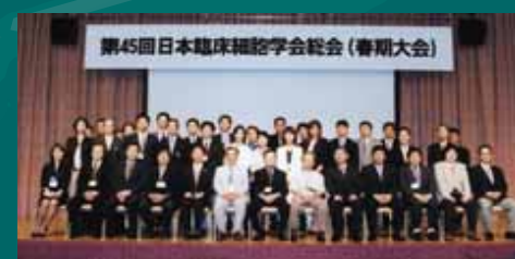
学会スタッフと共に