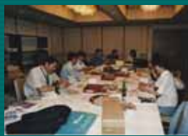
上段 学会スタッフルームにて 下段 会場風景