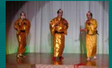
マツケンサンバショー