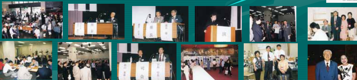
長谷川先生ご夫妻