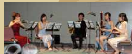
懇親会 昭和音楽大学木管五重奏の演奏