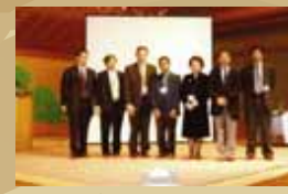
国際フォーラムにて