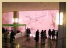
上段:市民公開講座会場に展示された細胞診標本の