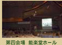
第四会場 能楽堂ホール