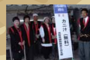
大好評! カニ汁 ごちそうさます!!