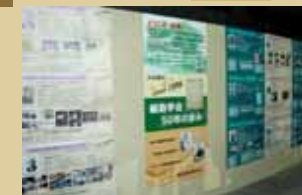
常設展示 細胞学会50年の歩み