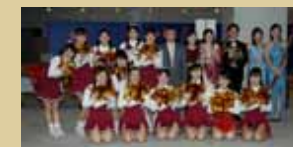
都竹事務局長を囲んで