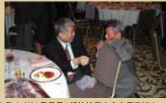
小島プログラム委員長と都竹検査士会会長密談中