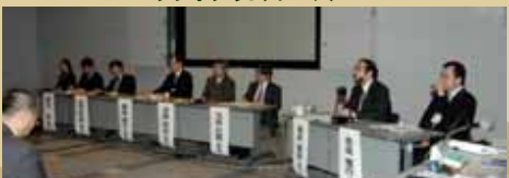
ワークショップの1コマ