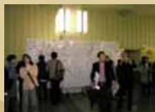
顕微鏡写真を大きく印刷した巨大な垂れ幕