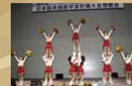
懇親会 早稲田大学チアリーダーズのパフォーマンス