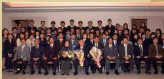
学会スタッフと共に