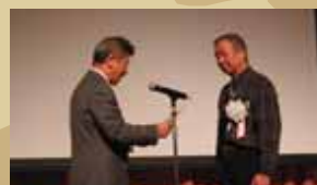
都竹検査士会会長から学会長に感謝状授与